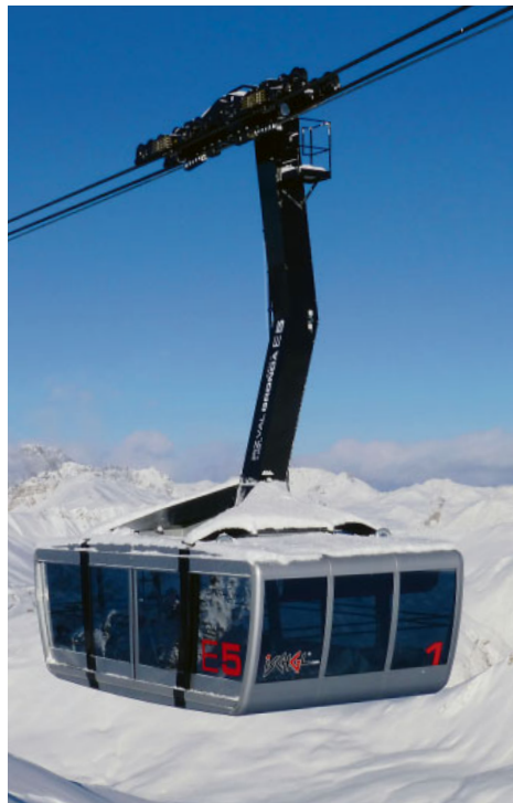
Pendelbahn am Piz Val Gronda: 150-Personen-Gondeln, Tragselle mit Kupfer-Adern zur Stromübertragung