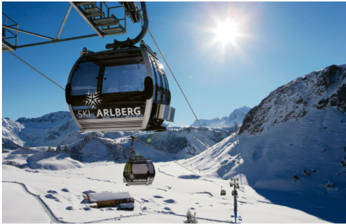
Der Auenfeldjet verbindet die Skigebiete Warth-Schröcken und Lech. In Lech fädelt sich die 10er-Kabinen auf das Seil einer bestehenden Sesselbahn ein.